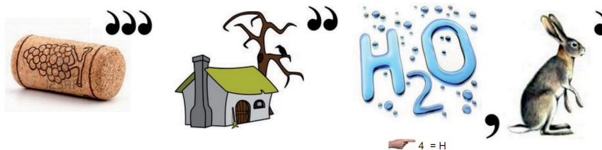
Рис. 2. Ребус «Производная»

Догадайтесь, какая из предложенных функций является решением уравнения dy + ytgxdx = 0 .